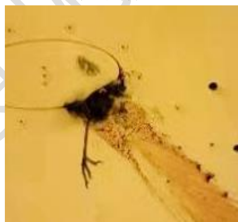
附图 4 鸟击残留肢体