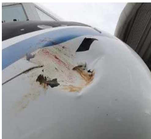
附图 1 鸟击残留血迹