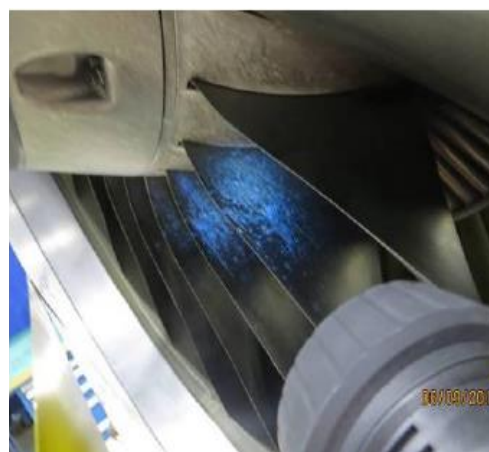
附图 2 荧光照射检查下的 鸟击残留血迹